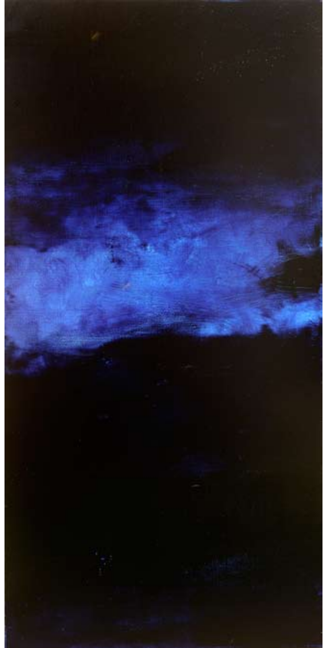
Sans titre - Huiles sur toile 60x120cm - 2012