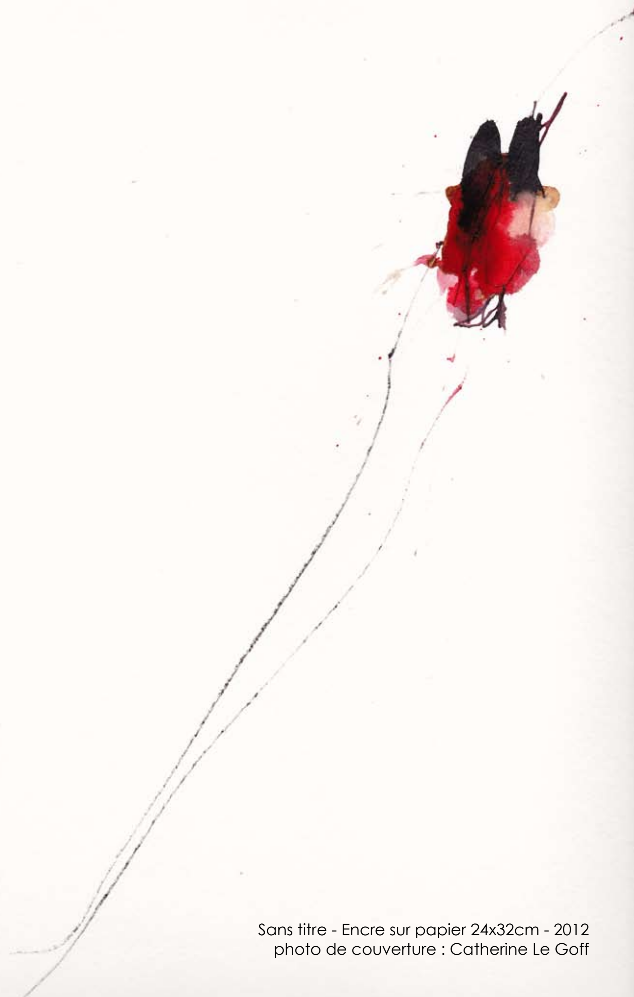
Sans titre - Encre sur papier 24x32cm - 2012