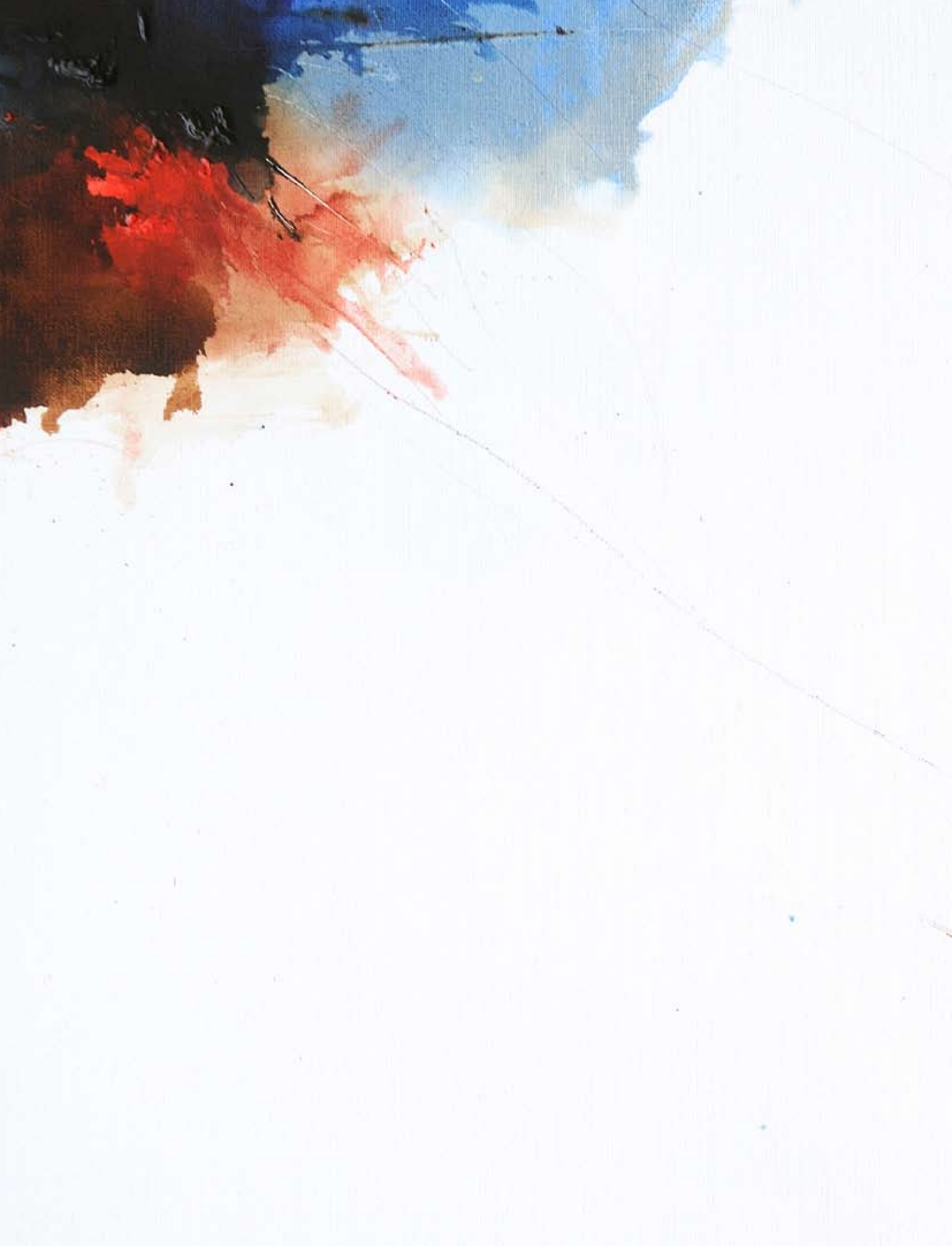
Sans titre - Technique mixte sur toile 60x60cm détail - 2011