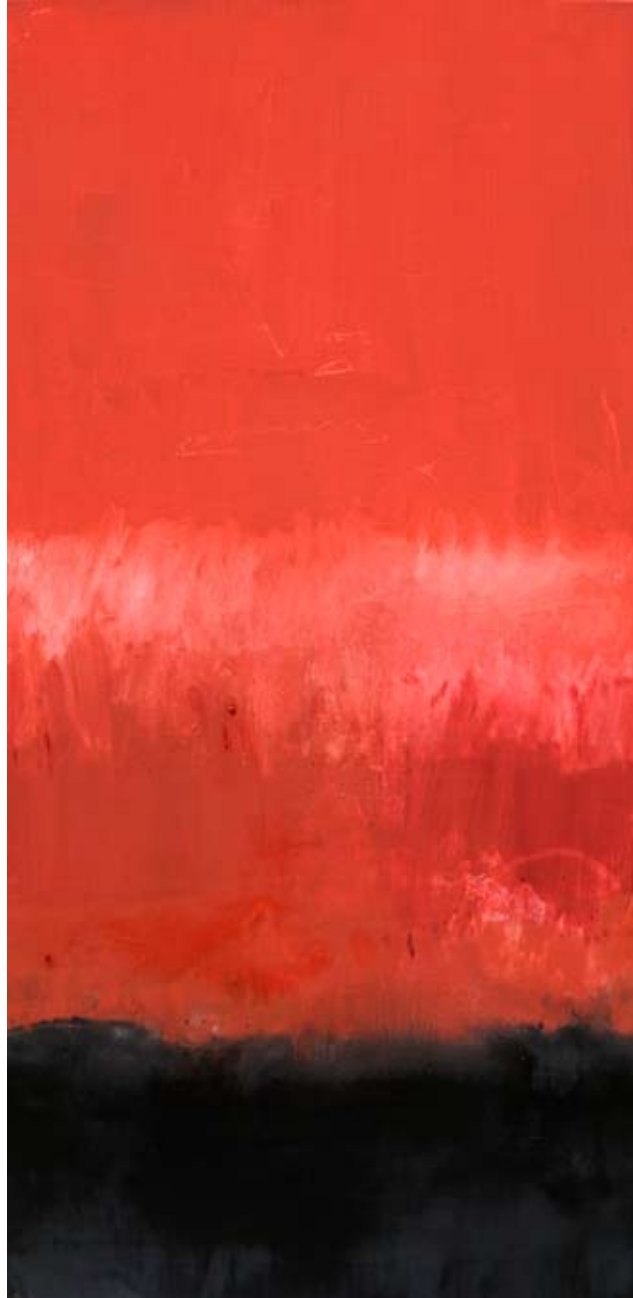
Sans titre - Huile sur toile 60x120cm - 2012