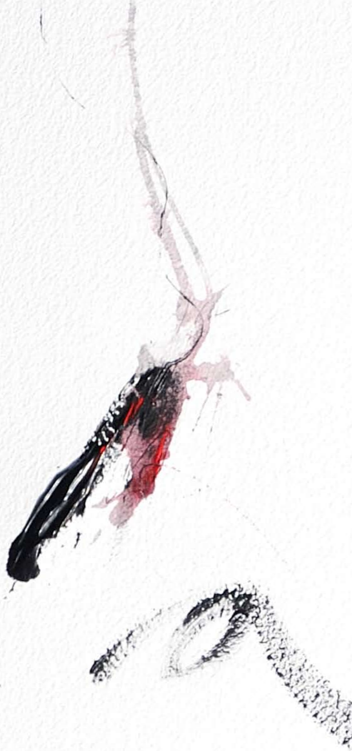
Sans titre - Acrylique sur Arches 56x76cm - 2010